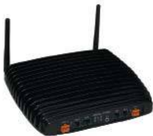
► Модуль Audio Interface Unit (AIU)