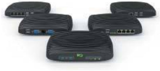
▲ Примеры различных FACE-модулей