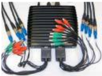
► FM-VC с набором переходников

FM-XTDEU2/4 и FM-XTDM2 предоставляют пользователю возможность установки на FACE различных устройств в форм-факторе mini PCI Express. Это могут быть различные модули связи сотовых сетей, приемные устройства GPS/ГЛОНАСС, модули беспроводных сетей Wi-Fi и Bluetooth, модули TV-тюнеров и платы аппаратного кодирования/декодирования видеопотока. Одним словом, на базе указанных модулей