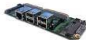
◀ Модуль FM-XTDEU2/4

— Да, я абсолютно согласен, поэтому попытаюсь рассказать о вариантах применения вычислительных машин с разными модулями FACE на готовых примерах компании-изготовителя.